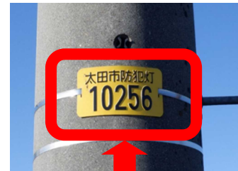
防犯灯管理プレート