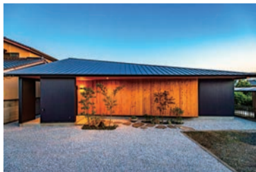
-まちのすきま- 大屋根の架かる平屋の家