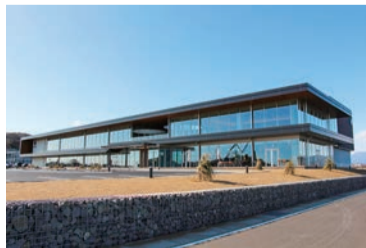
日東システムテクノロジーズ 本社オフィス