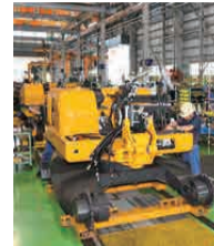
工場内の組み立てライン

時代のニーズに対応しCO 2 排出量の削減につながる電動化の製品開発を進めています。環境保全に配慮したものづくりを通し、社会貢献につなげたいと考えています。