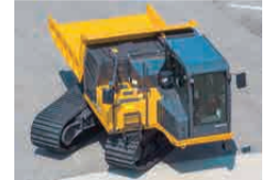
全旋回式クローラキャリア