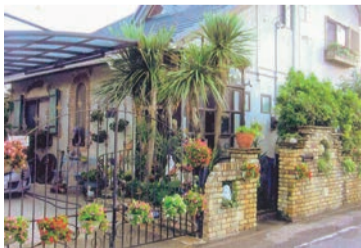
ヨーロッパ風 リビングガーデン