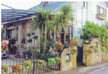
ヨーロッパ風 リビングガーデン