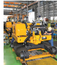
工場内の組み立てライン

時代のニーズに対応しCO 2 排出量の削減につながる電動化の製品開発を進めています。環境保全に配慮したものづくりを通し、社会貢献につなげたいと考えています。