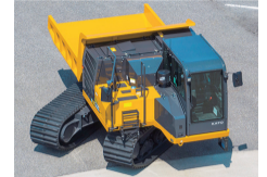
全旋回式クローラキャリア