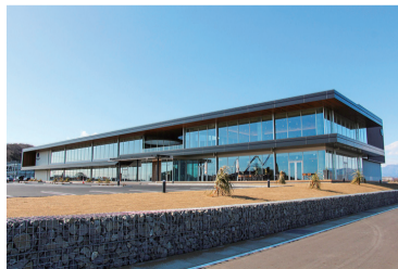
日東システムテクノロジーズ 本社オフィス