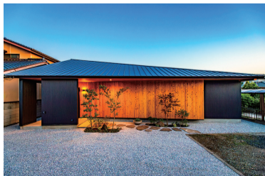
-まちのすきま- 大屋根の架かる平屋の家