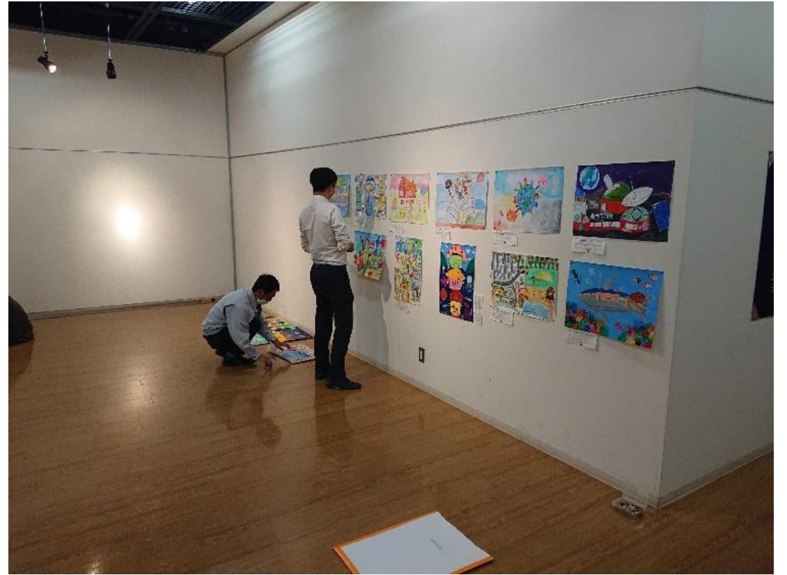
※一枚ずつ丁寧に掲示していきました。