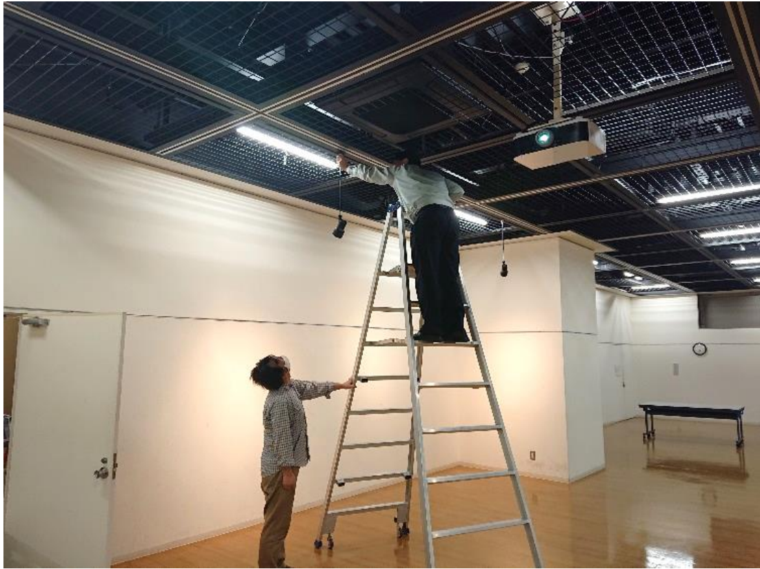
※スポットライト設置時、安全対策配慮しました。