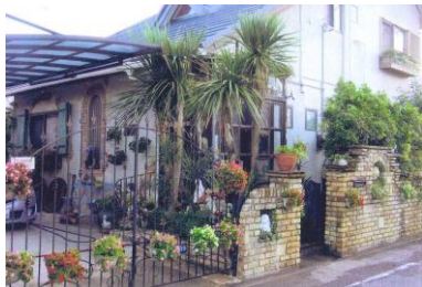
【大賞】ヨーロッパ風リビングガーデン