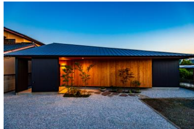
【賞】一まちのすきまー 大屋根の架かる平屋の家