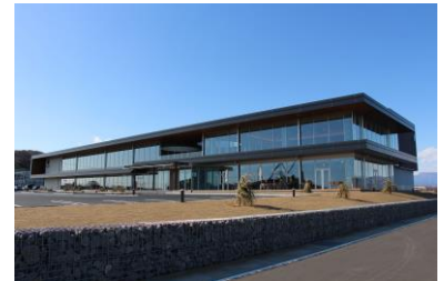
【賞】日東システムテクノロジーズ 本社オフィス