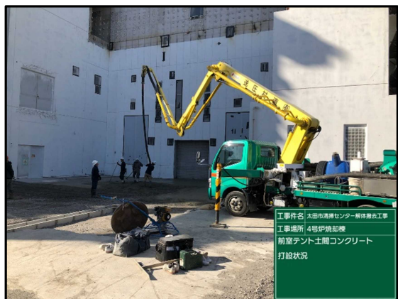
④ 4号炉焼却棟 仮設テント土間打設