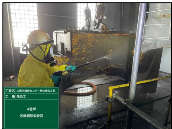
② 4号炉焼却棟 除染作業