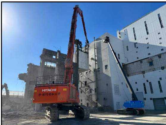
① 3号炉焼却棟 建屋解体