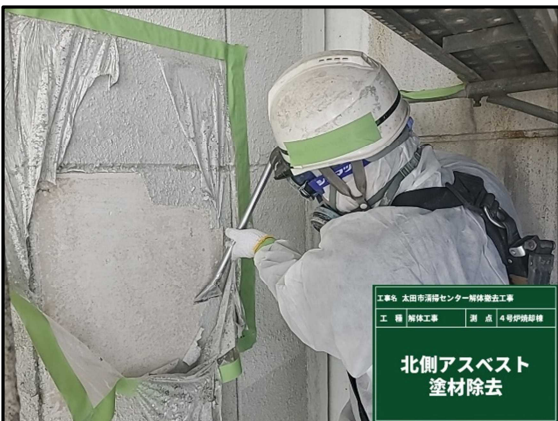
③ 4号炉焼却棟 外壁アスベスト除去