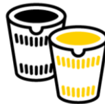
インスタント食品