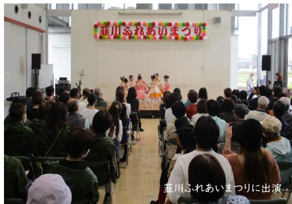
蕪川ふれあいまつりに出演