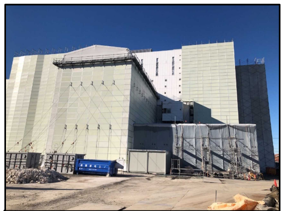
② 4号炉焼却棟 仮設テント設置