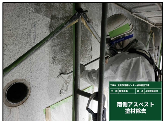
④ 4号炉焼却棟 外壁アスベスト除去