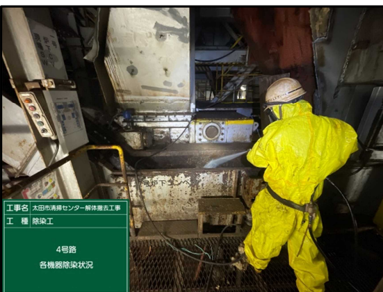
③ 4号炉焼却棟 除染作業