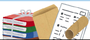
本・雑誌・雑がみ