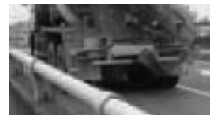
騒音・振動の抑制