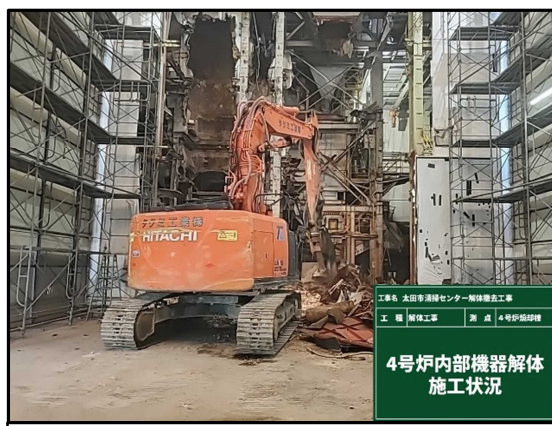
② 4号炉焼却棟 機器解体