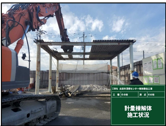
③ 計量棟 解体