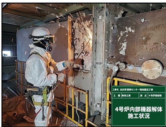
① 4号炉焼却棟 機器解体