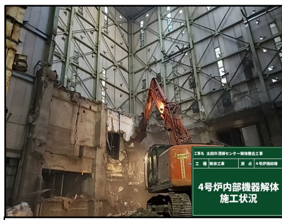
② 4号炉焼却棟 機器解体