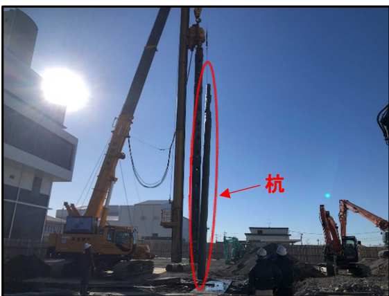
③ 粗大ごみ処理施設 杭抜き