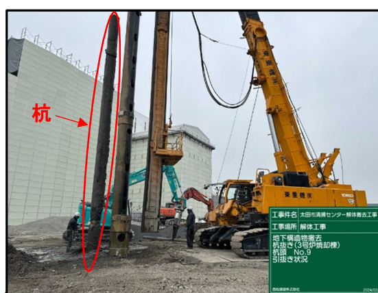
④ 3号炉焼却棟 杭抜き