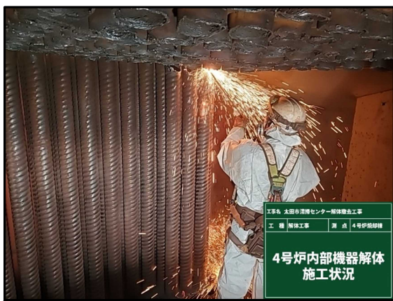
① 4号炉焼却棟 機器解体