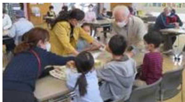
「グラウンドゴルフ大会」