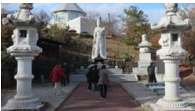
館外研修「ハッ場ダムと鬼押し出し園の散策」