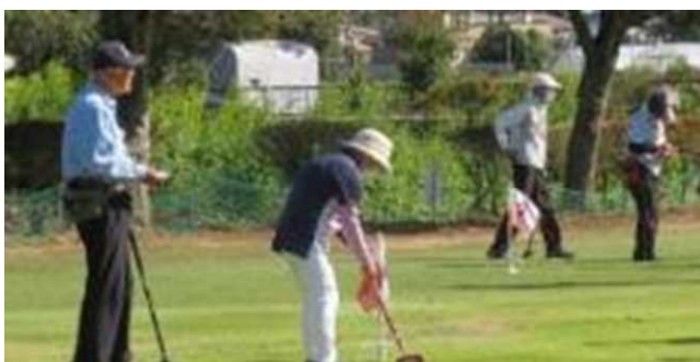
「グラウンドゴルフ大会」