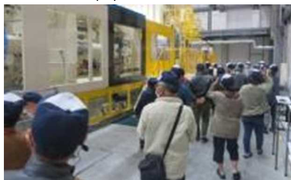
「しげる工業(株)きざきプラント工場見学」