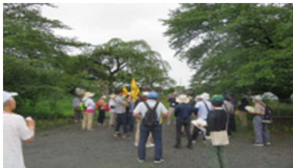
「木崎史跡巡りウォーク」