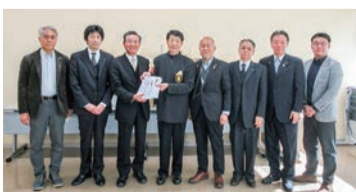
太田・太田西・太田南・新田・太田中央5ロータリークラブより