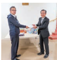
スバル地域交流会より