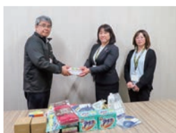
明治安田生命保険相互会社太田支社西太田営業所より