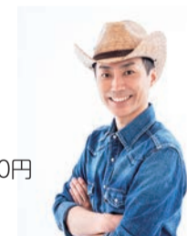
恐竜くん

日時 8月3日(土) 午後2時～ 会場 藪塚本町文化ホール チケット(全席指定) 一般=2000円、高校生以下=1000円 ※3歳未満は入場できません。