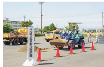
土砂災害対応訓練