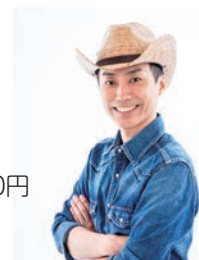
恐竜くん

日時 8月3日(土) 午後2時～ 会場 藪塚本町文化ホール チケット(全席指定) 一般=2000円、高校生以下=1000円 ※3歳未満は入場できません。