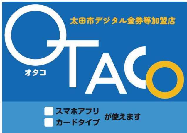
Adesivo de Loja Afiliada

Poderá ser utilizado em lojas afiliadas ao Voucher Digital Municipal de Ota, identificadas por banner e adesivo à seguir.