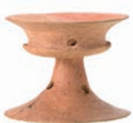
高林鶴巻古墳群 土師器器台