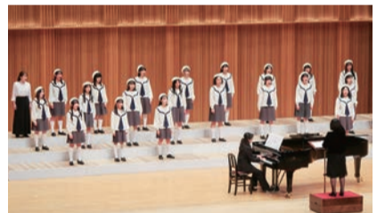
コール エンジェル