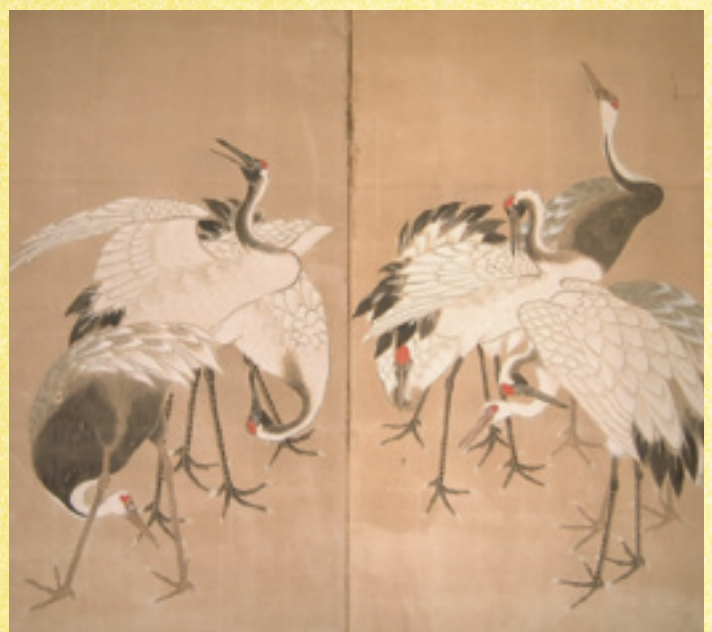
樋口春翠筆 群鶴図屏風（部分）