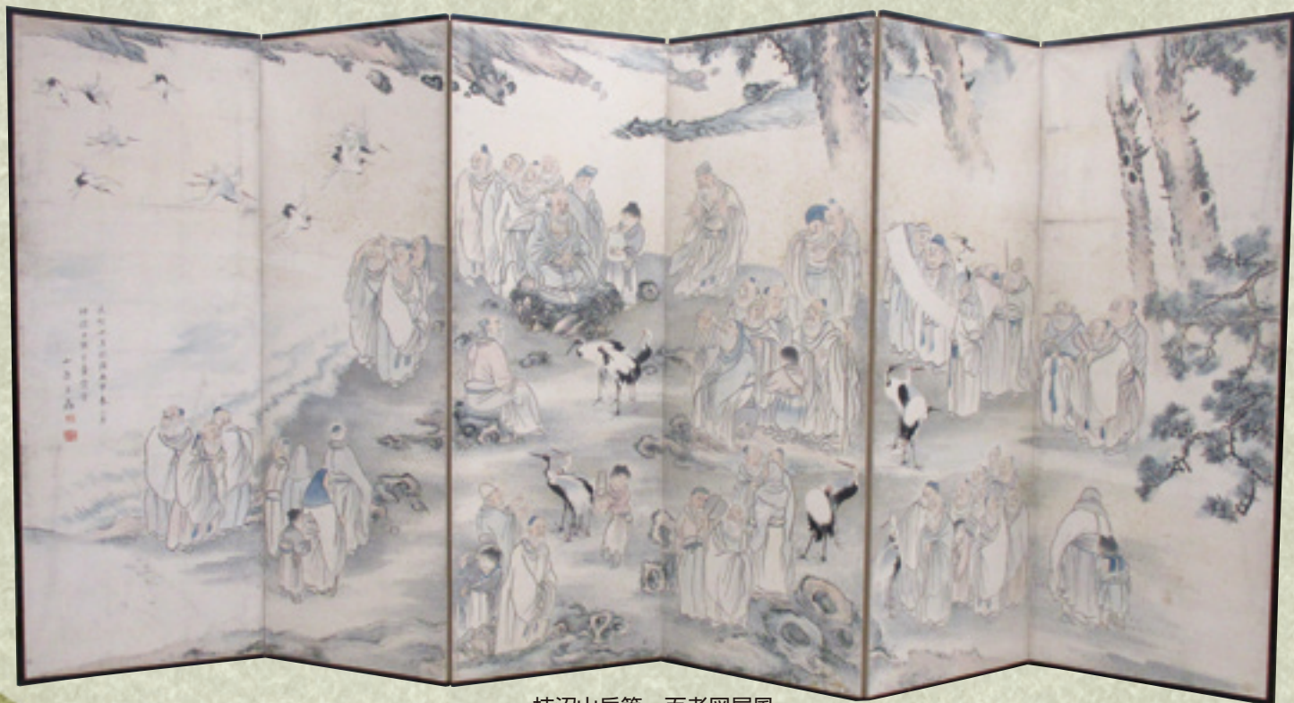
柿沼山岳筆 百老図屏風