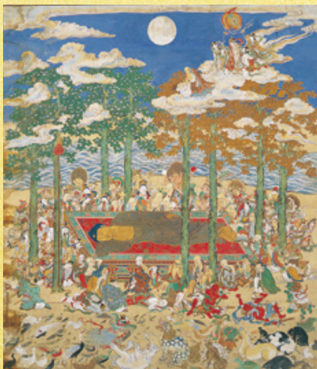
岩松孝純筆 涅槃図