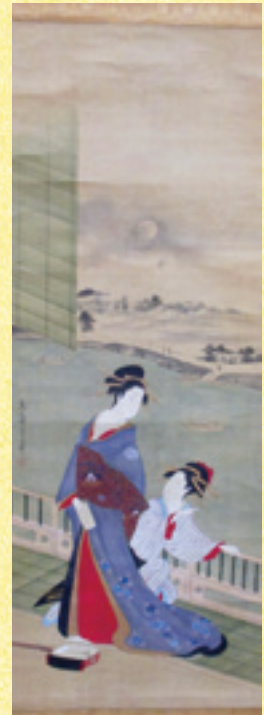
鳥文斎栄之筆 隅田川畔二美人図