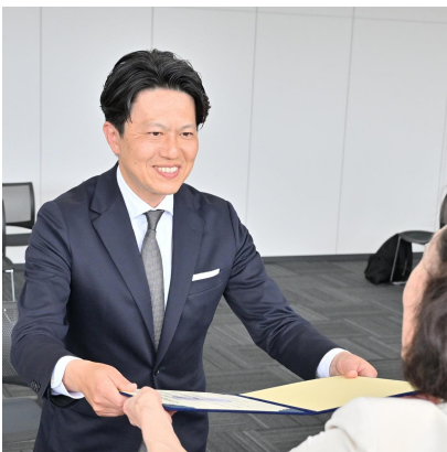
(当選証書付与式にて)

太田市の新市長として、これまでの市政の良き歩みを真摯に受け継ぎつつ、新たな時代にふさわしい市政を力強く進めてまいります。