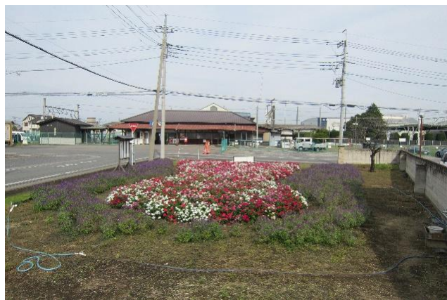
Actividades de Protección Ambiental