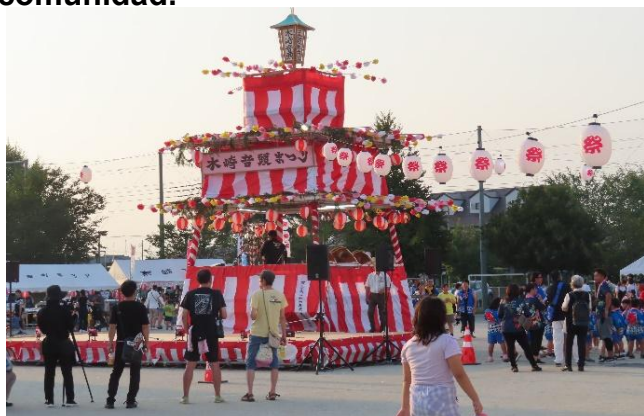
Festivales “Omatsuri” y otras Actividades de Intercambio

La Asociación desenvuelve actividades como la prevención de desastres, las patrullas de seguridad, la seguridad infantil, limpieza, etcétera, por la creación de una comunidad confortable para vivir, cooperando y apoyándose unos a otros entre los habitantes de la comunidad.