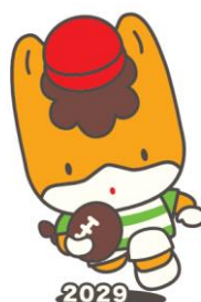
ラグビーフットボール