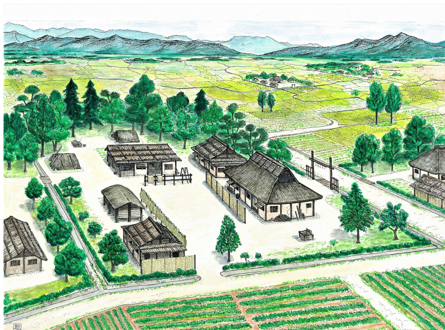
飯塚聡 《新田荘の有力農民 の屋敷（想定図）》