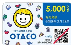
▲配布したカードデザイン