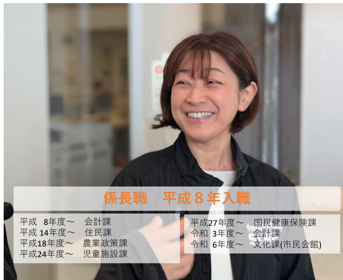
係長職 平成8年入職

平成8年度～ 会計課 平成27年度～ 国民健康保険課 平成14年度～ 住民課 令和3年度～ 会計課 平成18年度～ 農業政策課 令和6年度～ 文化課(市民会館) 平成24年度～ 児童施設課