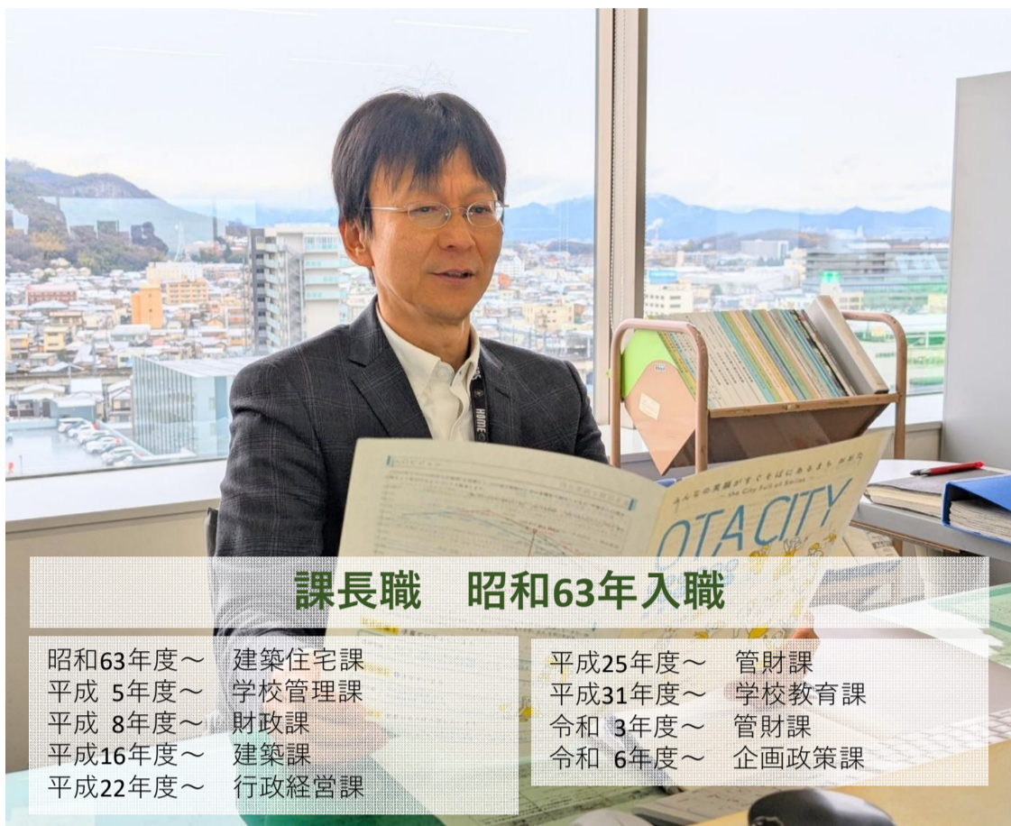
課長職 昭和63年入職

昭和63年度～ 建築住宅課 平成25年度～ 管財課 平成5年度～ 学校管理課 平成31年度～ 学校教育課 平成8年度～ 財政課 令和3年度～ 管財課 平成16年度～ 建築課 令和6年度～ 企画政策課 平成22年度～ 行政経営課