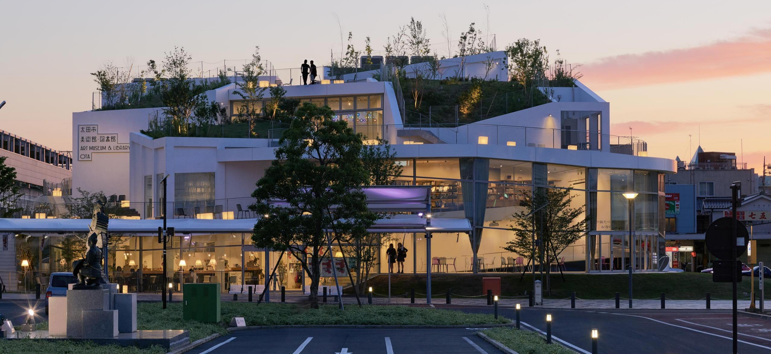
みんなの笑顔がすぐそばにあるまち おおた