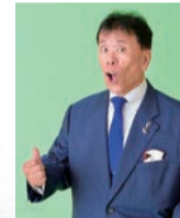
ホームランたにし