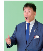
ホームランたにし