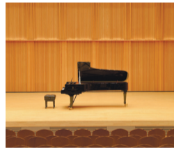
ホール グランドピアノ (スタインウェイ)