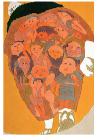
あきこ屋(日本)「遠野物語」 (柳田国男ノ作)