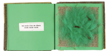
「のほら」ジャンニ・ロダーリ(文)、ジョルジャ・A、ミケロン・ディ・フォッリ(作)プロトタイプ制作 2018年