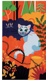
ピニャ・メレトヤ(フィンランド) 「ネコのカスリと森の動物シェルター」