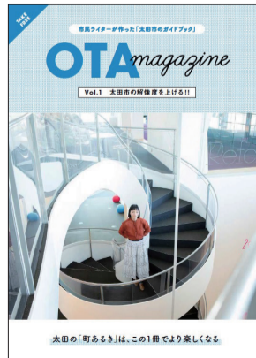
太田市ガイドブック