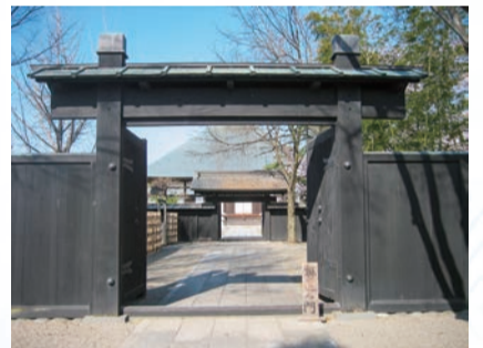
満徳寺(駆け込み門)