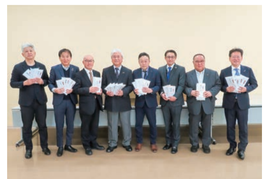
第4分区A太田5ロータリークラブより