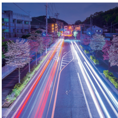
ハナミズキ咲く通勤路 H30.5 東本町