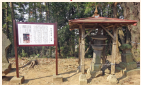
円福寺石幢(改修前・改修後)