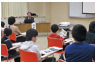
学習室で講義の様子