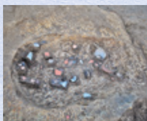
土坑出土遺物(西から)