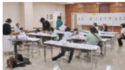
ストラップ作成の様子

透明プラスチック板を使い、文化財課オリジナルのイラストを写し取り、ストラップを作りました。