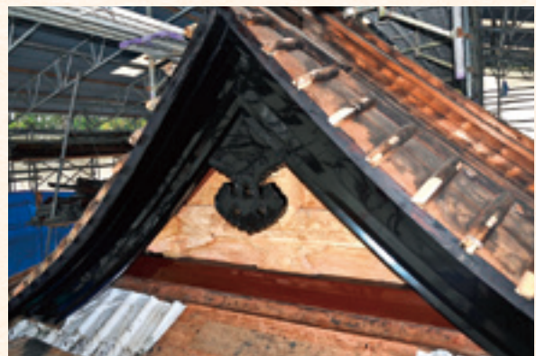
拝殿屋根破風の漆塗(上塗※最終塗装)完了状況