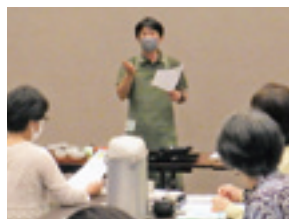
日本茶の美味しい入れ方