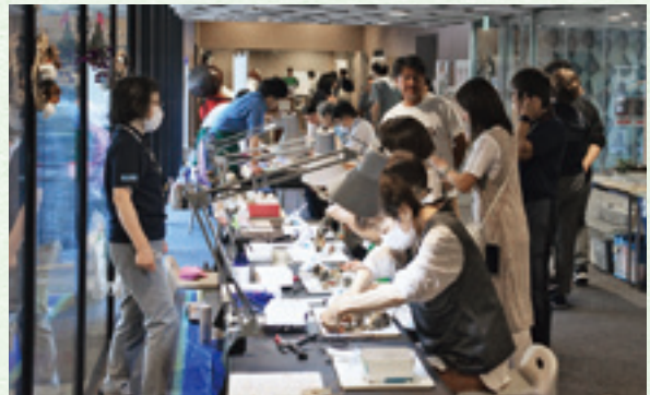
木の実を使ったリースづくり教室