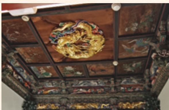
聖天宮天井付近の彫刻