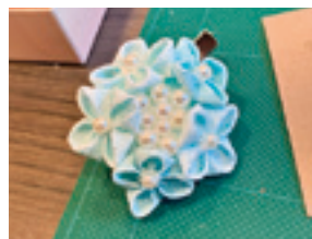
梅雨晴れにきらめく花飾り