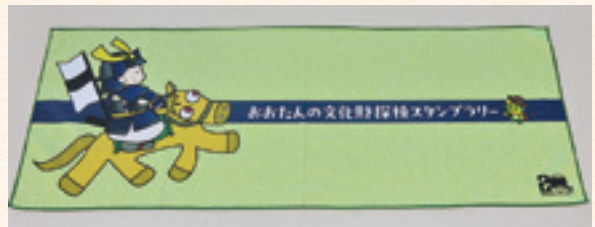
記念品(かなざえもん冷感タオル)