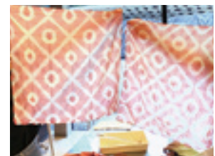
茜でバンダナを染める