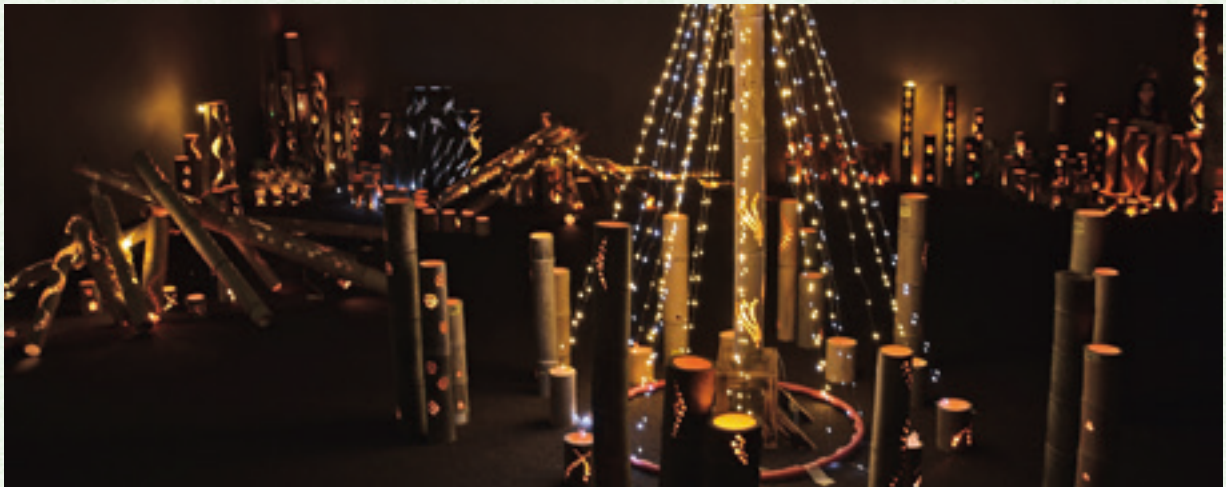
金山二ノ丸竹林整備ボランティア「金竹連」による竹あかりの展示

本事業は文明元年(1469)に金山城が築城されてから555年となるのとともに、太田市が合併20周年を迎えることを記念し開催したところ、1,200名を超える方にご来場いただき、盛況のうちにイベントを終えることができました。