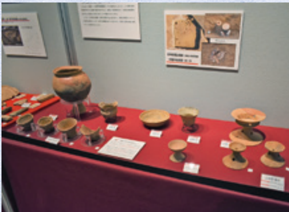
高林鶴巻古墳群(令和4年度調査)で出土した土器類