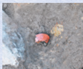
漆器片出土状況(西から)