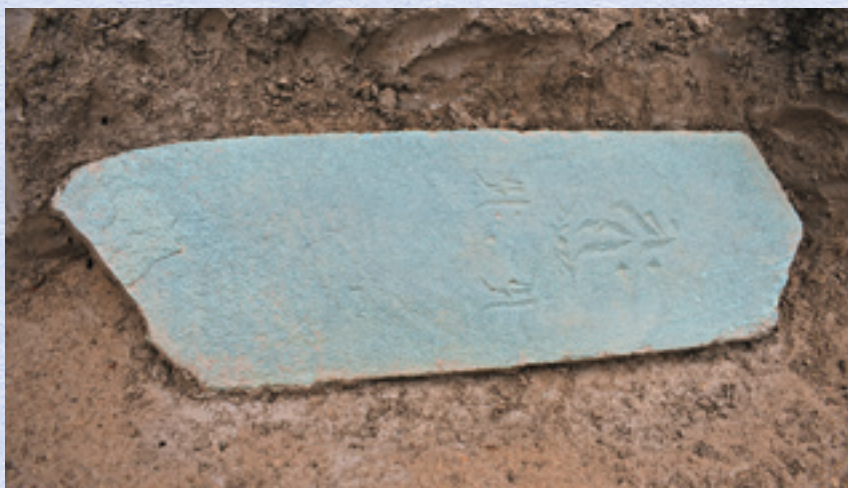
板碑片出土状況(東から)