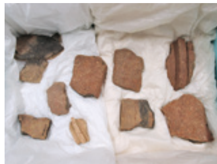
参考資料：朝子塚古墳の埴輪片