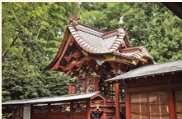
冠稲荷神社の本殿