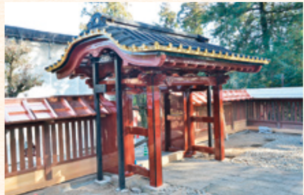
唐門の改修工事後