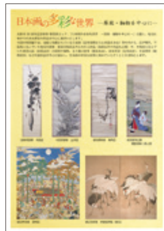
チラシ・ポスター