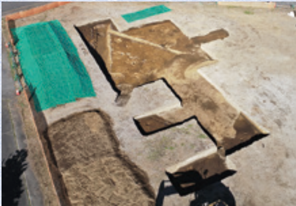
調査区全景(南から)

調査区の周辺は、新田郡家や東山道駅路(武蔵路含む)など、奈良・平安時代の重要施設が集中していました。今回の調査成果も、これら施設との関連が予想されます。