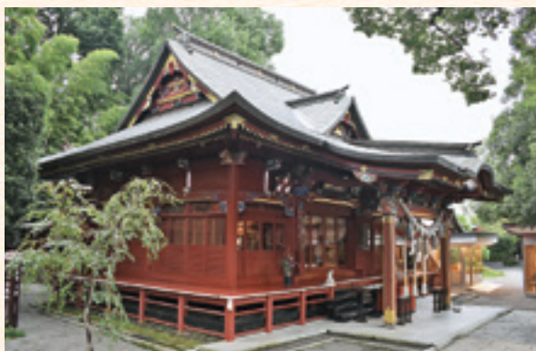
冠稲荷神社の拝殿