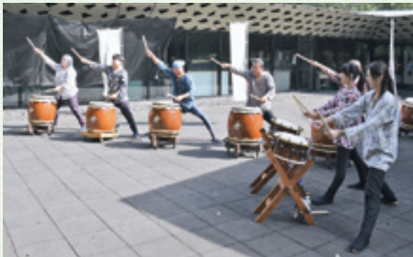
和太鼓三日月による迫力の演奏