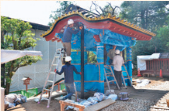
唐門の耐震補強材設置作業状況