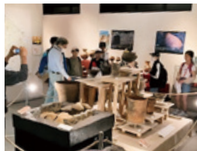
「考古展示」へ訪れた小・中学生