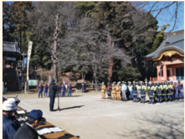
教育長による講評