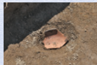
竪穴建物跡出土遺物(南西から)