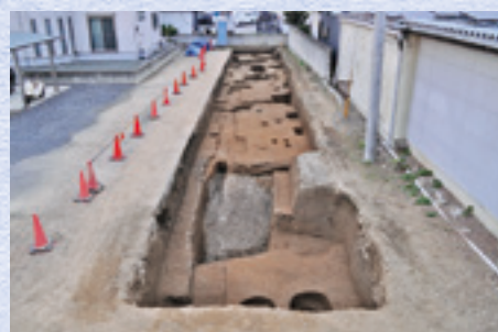
調査区全景(南から)