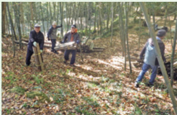
金山松・竹を愛する会による作業の様子