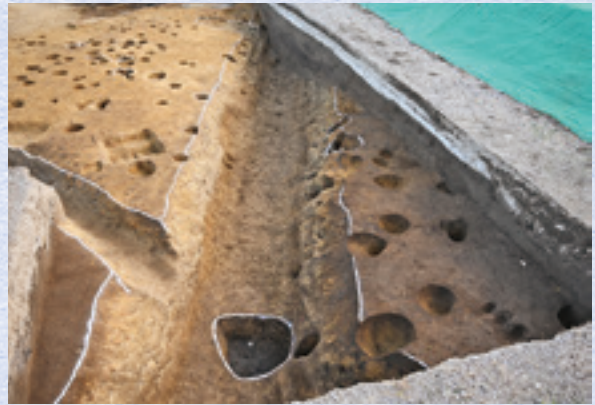
方形区画の溝(北から)