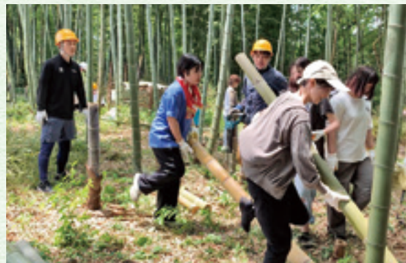
金竹連による竹林整備の様子