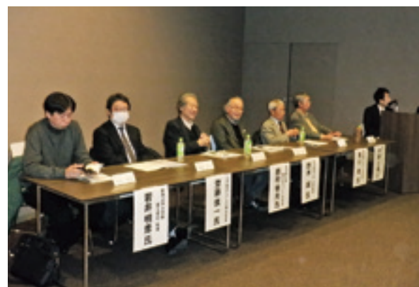
シンポジウム登壇者