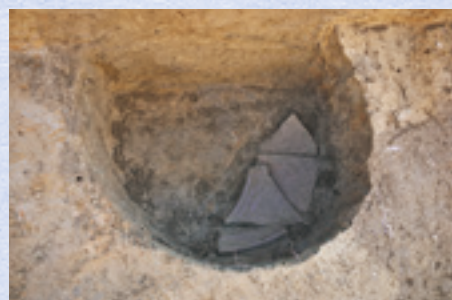
中世の陶器片出土状況(西から)