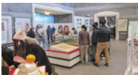
正月特別開館の様子▶