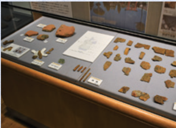
東矢島古墳群出土の埴輪・鉄製品