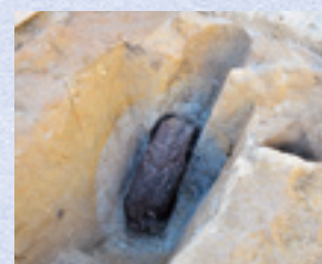
柱材出土状況(南東から)