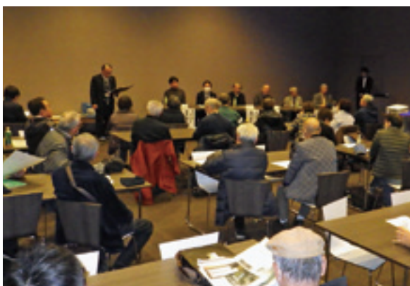
シンポジウム開催状況