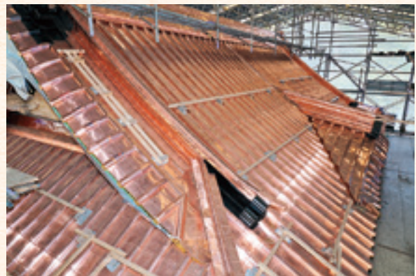
拝殿屋根の銅瓦葺施工状況(全体の9割完了)