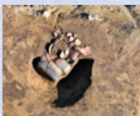
土坑出土遺物(東から)