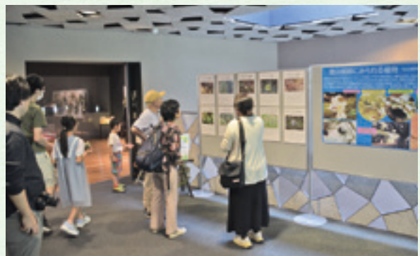
金山の自然に関する展示