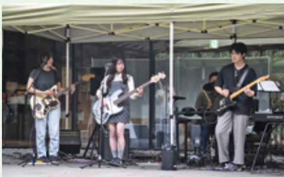
市役所音楽部によるバンド演奏