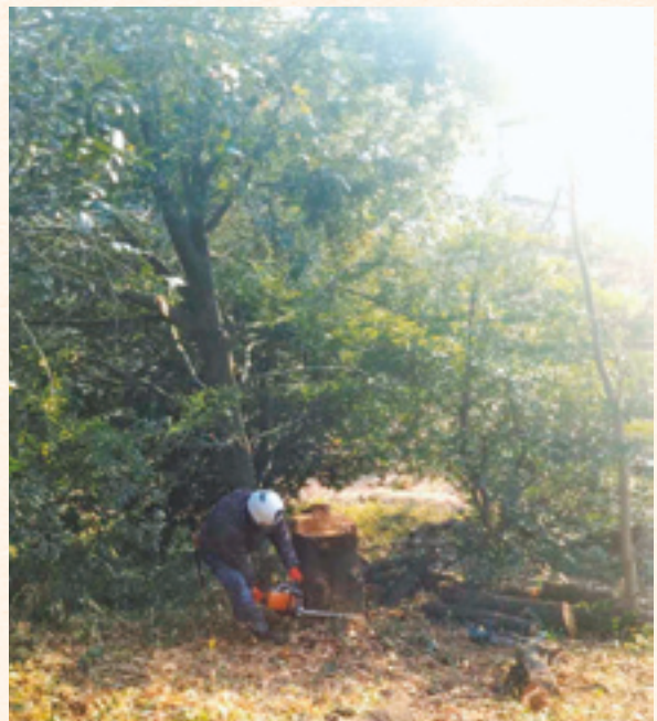
朝子塚古墳樹木伐採の様子