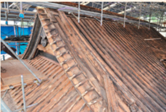
拝殿修理前の銅瓦取り外し完了状況