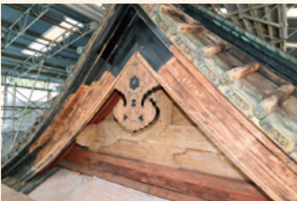
拝殿屋根破風における傷んだ旧漆塗の掻落完了状況