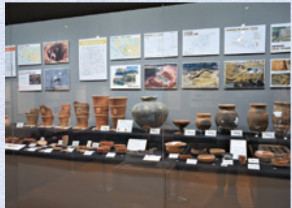
土器・埴輪の展示状況