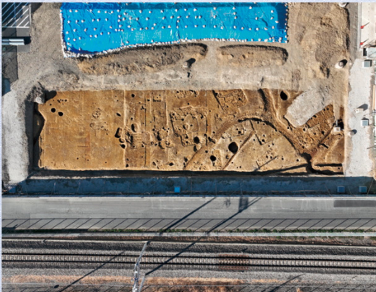
調査区全景(上空から・上が西)

病院の増築工事に伴い発掘調査を実施しました。調査地から北西側は、平成22年に発掘調査を実施しており、古墳時代の竪穴建物跡や中世の大島城に関連する溝や土坑などが確認されていました。今回の調査では、古墳時代の竪穴建物跡6軒、土坑3基、中世の掘立柱建物跡1棟、溝5条、土坑4基、時期不明の竪穴建物跡6軒、土坑30基、ピット100基などが確認されました。また、縄文時代の土器片、古墳時代の土器片、木製品、中世の陶器片、かわらけ片、石製品、漆器片などが出土しました。