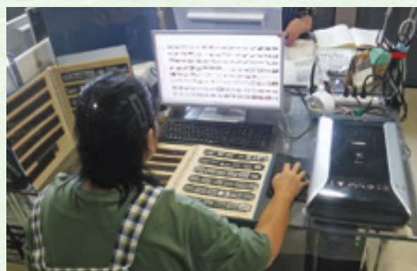
資料整理事業の様子

史跡の保存修理や発掘調査の結果について広く公開するために、報告書を編集するための基礎整理作業を行っています。今年度は金山城跡の発掘調査で記録した図面の基礎整理作業を実施しました。