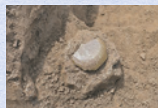
土坑出土遺物(北東から)