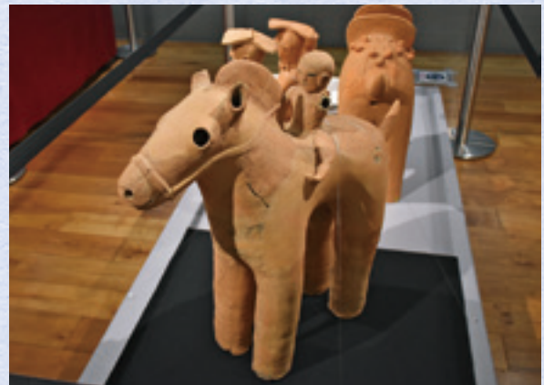
県立がんセンター所蔵の「人が乗る裸馬」埴輪