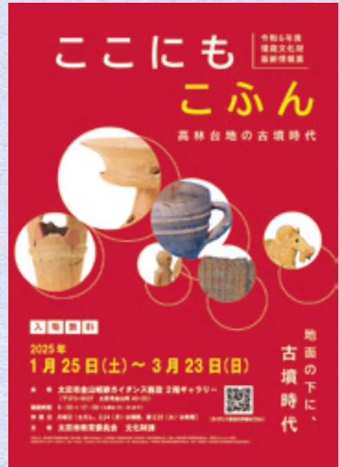
最新情報展ポスター

展示では、高林鶴巻古墳群の調査で出土した土器や埴輪のほか、県立がんセンター所蔵の「人が乗る裸馬」埴輪をはじめ、群馬県や群馬県立歴史博物館所蔵の遺物を借用し、古墳時代から飛鳥時代にかけての高林台地の様子 たかはしだいち をご紹介します。