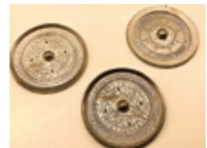
古代鏡をつくってみよう