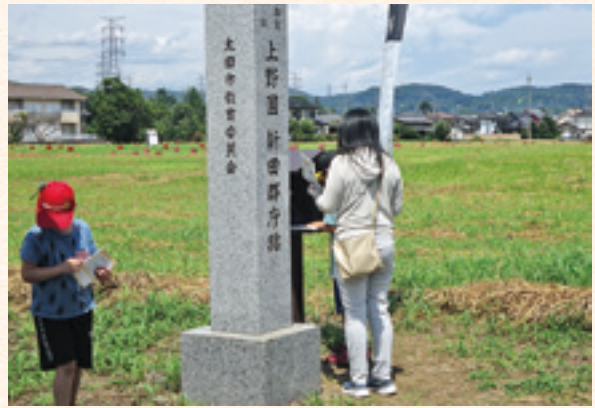
スタンプラリー実施状況

スタンプを設置した全22箇所のうち17箇所以上を巡ると修了認定されますが、今回は4,984名の参加申込があり、その内の3,572名が修了認定されました。修了認定率は、71.7%になりました。修了者には記念品として、文化財課イメージキャラクター「かなざえもん」の冷感タオルが贈呈されました。