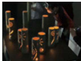
金山城の竹であかりを作ろう