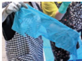
藍の生葉で空の色を染める