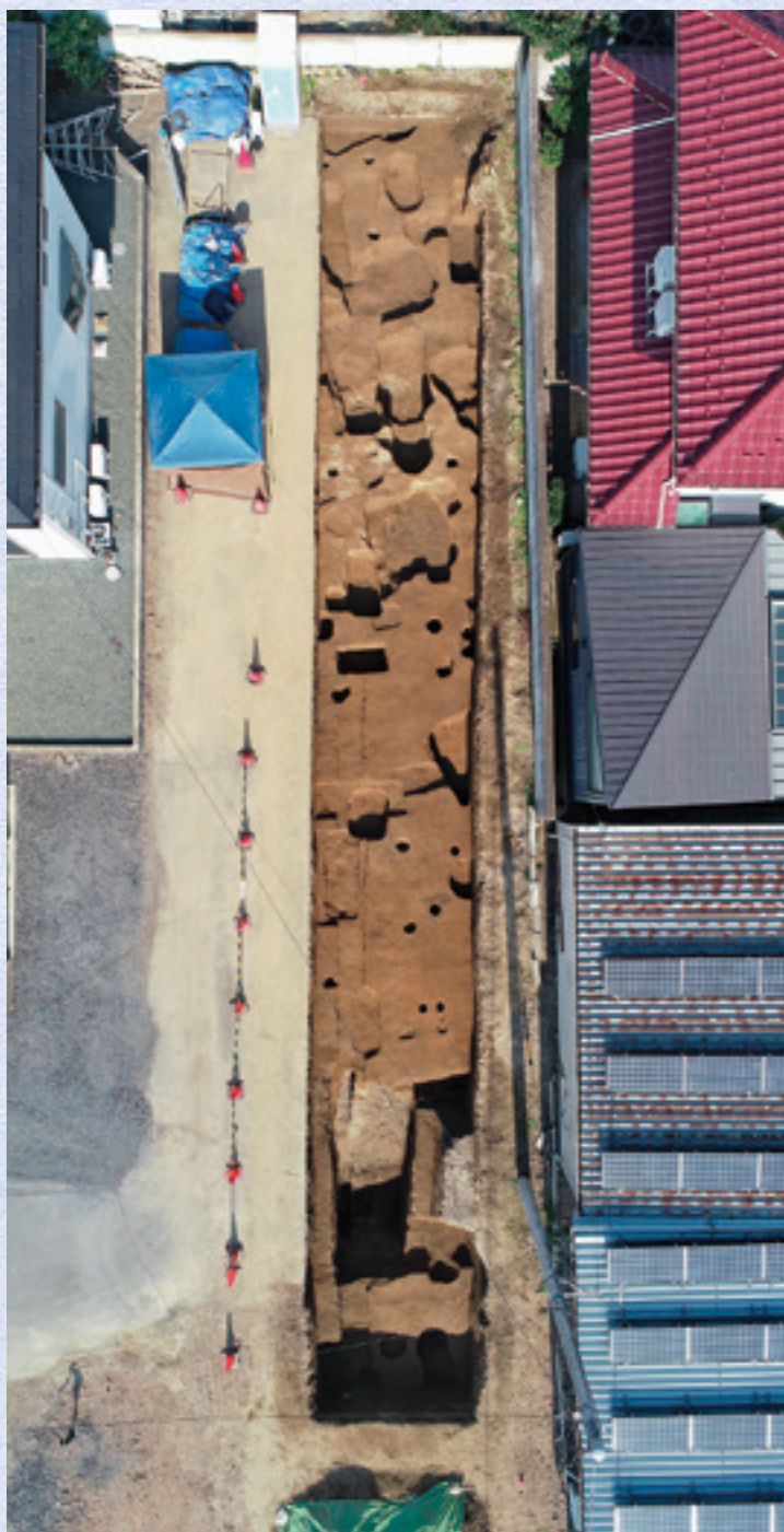
発掘調査調査区全景(上空から・上が北)

尾島東部土地区画整理事業の区画道路建設に伴い発掘調査及び立会調査を実施しました。その結果、中世以降の溝1条、中世から近世の土坑35基、ピット1基などが確認されました。また、中・近世の陶磁器片やかわらけ片などが出土しました。