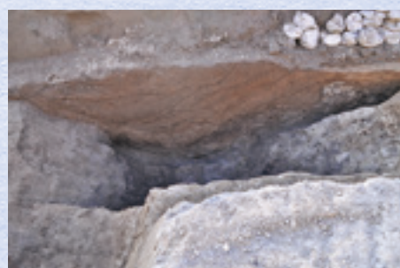
中世以降の溝(東から)