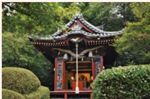
冠稲荷神社の聖天宮