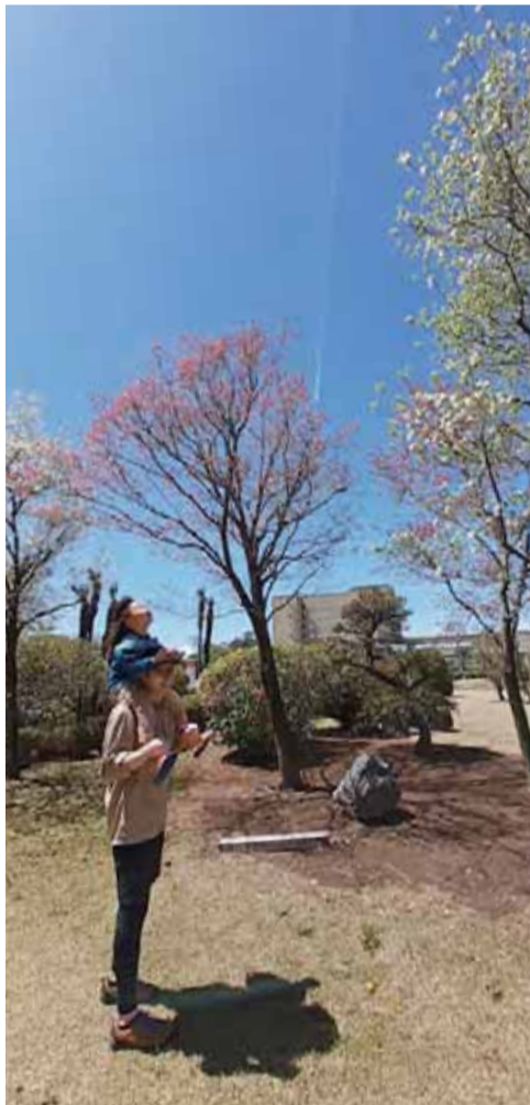
飛行機雲みつけた! R2.4 県立がんセンター