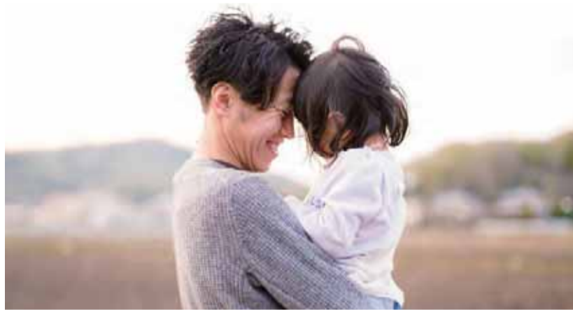
太田に移住して1年。東京ではできなかったコト R2.4 自宅付近の田んぼ