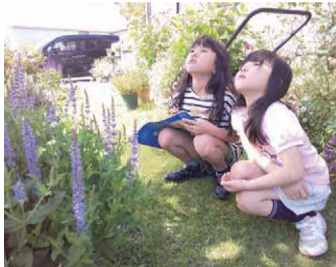
木の観察 R2.5 自宅