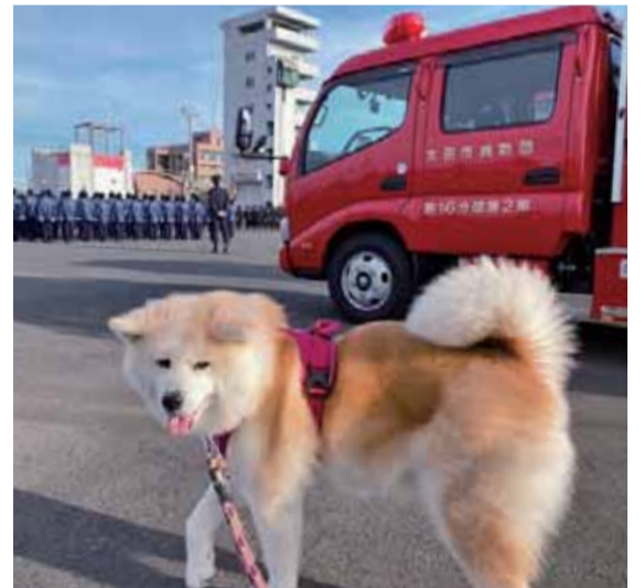
私も出初め式 R2.1 市消防本部

「時間を自由に使ってほしいな」と言われてもステイホーム令は不自由でしかない。これくらいなら、と本屋さんに掛けた。知人に会うとほつとする。「ここにしか行くところがない」と互いにボヤいた。そのうち、本を買って喫茶店まで歩いて行って読むことを何度か続けていくうちに、読書ではなく「歩く」ことにこだわりの始めたのである▼昨日は内ヶ島を大回りしてイオン。バス乗り場のベンチに座ったらもう動けない。仕方なく8時のバスに乗った。万歩計は8900歩。明日は呑龍様かな「バスは無いよ」。念のため。(5/25記)