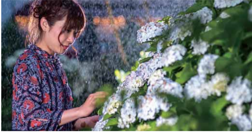
今はなき、植木野町のあじさい H30.6 植木野町