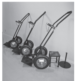
太田産業技術専門校溶接クラフト科卒業製作