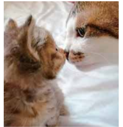
お兄ちゃんと R2.4 自宅