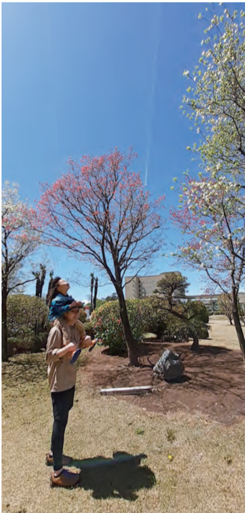
飛行機雲みつけた! R2.4 県立がんセンター