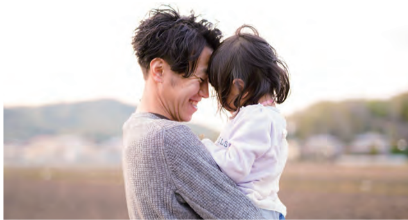
太田に移住して1年。東京ではできなかったこと R2.4 自宅付近の田んぼ