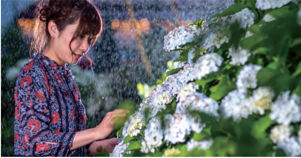
今はなき、植木野町のアじさい H30.6 植木野町