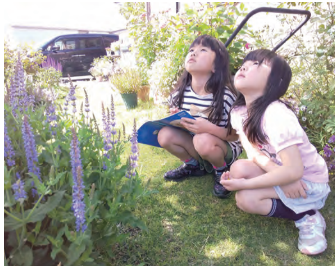
木の観察 R2.5 自宅