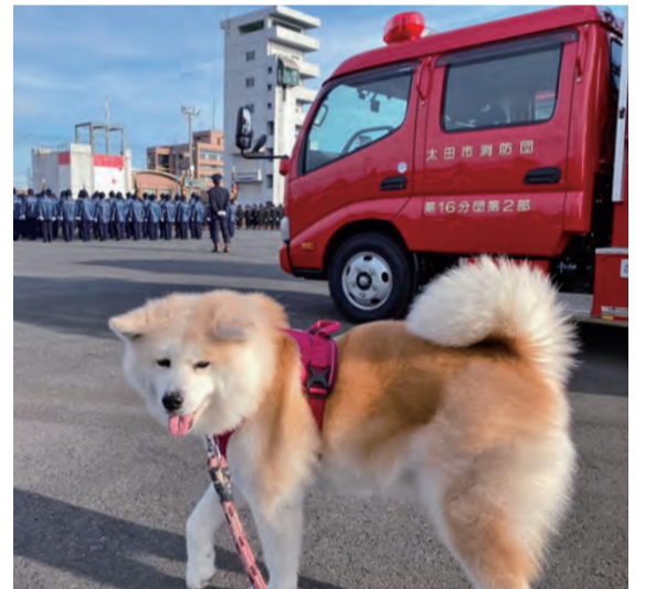
私も出初め式 R2.1 市消防本部

「時間を自由に使ってほしいな」と言われてもステイホーム令は不自由でしかない。これくらいなら、と本屋さんに掛けた。知人に会うとほつとする。「ここにしか行くところがない」と互いにボヤいた。そのうち、本を買って喫茶店まで歩いて行って読むことを何度か続けていくうちに、読書ではなく「歩く」ことにこだわりの始まったのである▼昨日は内ヶ島を大回りしてイオン。バス乗り場のベンチに座ったらもう動けない。仕方なく8時のバスに乗った。万歩計は8900歩。明日は呑龍様かな「バスは無いよ」。念のため。(5/25記)