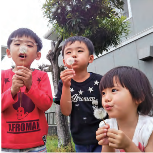
一緒にふ〜っ! R2.5 東別所町