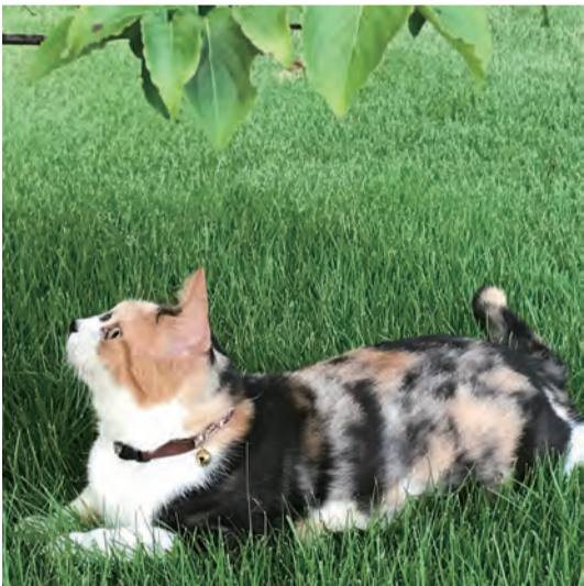
見つけたニャ! R1.8 自宅