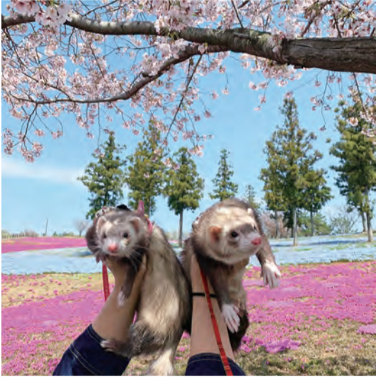
フェレンボ R2.4 北部運動公園