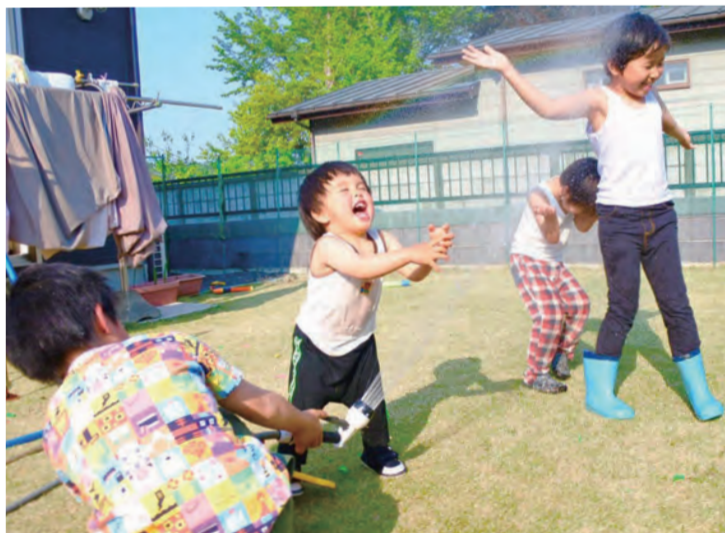
お庭で水遊び(^^) R2.4 友人宅