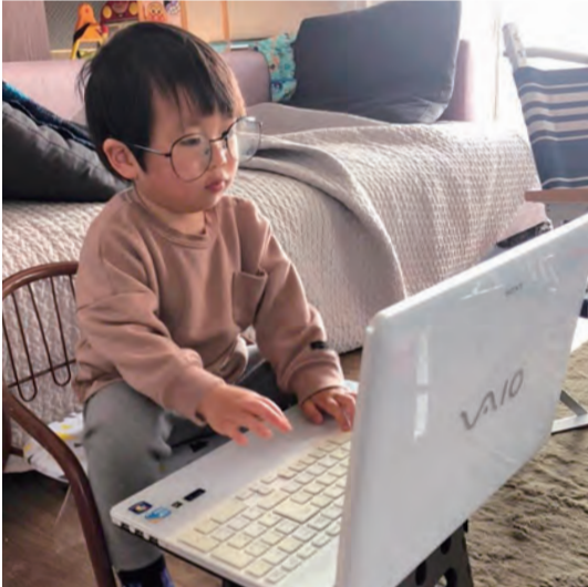
ボクもテレワークしてます R2.4 自宅