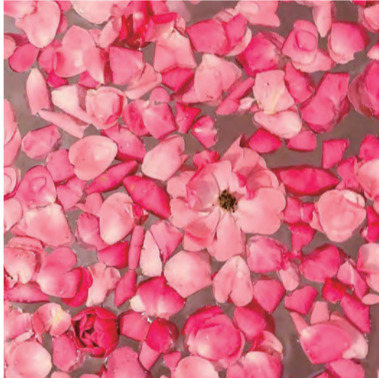
ハッピーのWA!! 女の子の憧れバラのお風呂 R2.5 自宅