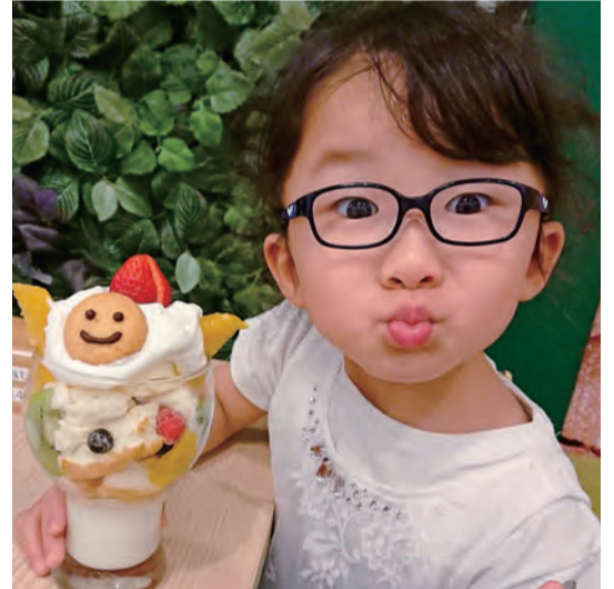
心もお腹もハッピー! R1.5 下小林町