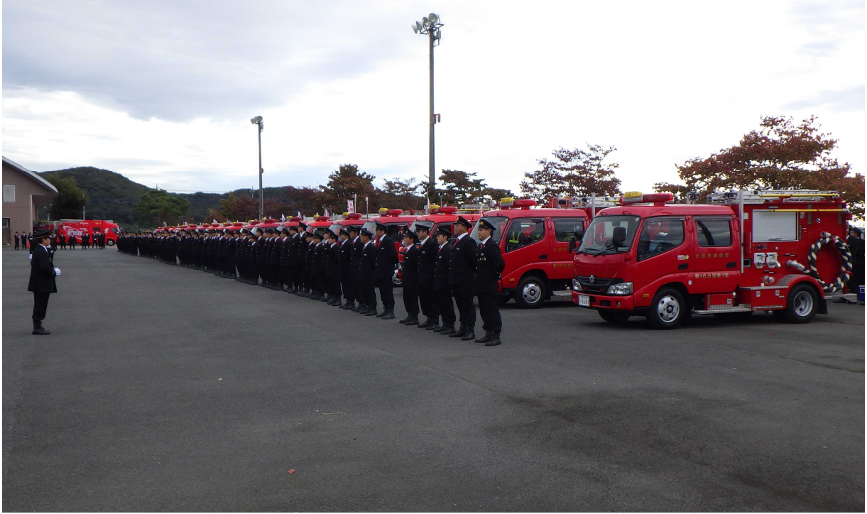
令和7年10月19日 太田市消防団秋季点検(中央消防署 敷地内にて)