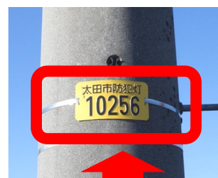
防犯灯管理プレート

不点灯などの灯具の不具合は、プレート番号を確認の上、コールセンター(電話:0570-666-181 夜間休日含め24時間対応)へ直接連絡も可能です。(夜間休日含め24時間対応)