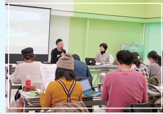
ワークショップのイメージ

プロのデザイナーやカメラマン・ライターなどを講師に迎え、講義やワークショップを通じて皆さんと一緒に制作します。奮ってご参加ください。