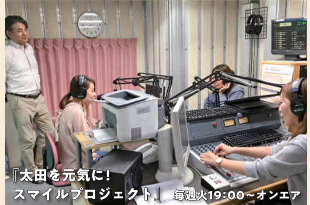
「太田を元気に! スマイルプロジェクト」 毎週火19:00~オンエア

地元コミュニティラジオ局エフエム太郎での番組制作と放送を通じて、地域の魅力と課題について発見・発信しています(現在は、一部内容を変更し収録)。