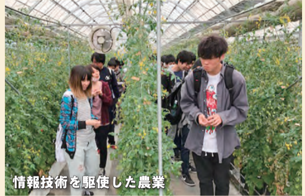
情報技術を駆使した農業

同大学では、経済学・経営学をベースに、ICTを駆使した学内スマート農業施設を活かし、6次産業化を生産から加工・流通・販売までトータルで学んでいます。