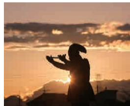
最優秀賞 夕日と義貞像