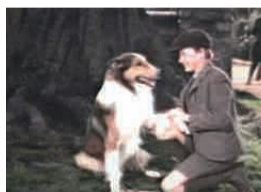
名犬ラッシー(家路)