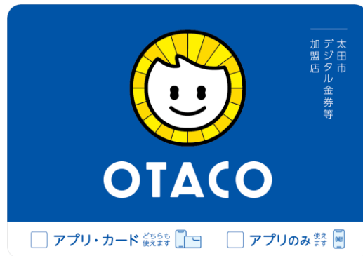
Adhesivo de Tienda Afiliada

Podrá ser utilizado en tiendas afiliadas al Voucher Digital Municipal de Ota, identificadas por las pancartas y adhesivos a seguir.