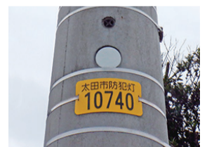
プレート番号を確認