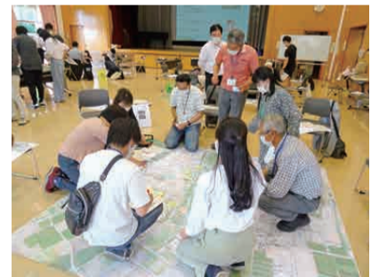
ワークショップ② 広域エリアでのにぎわいを考える