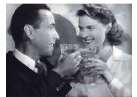
カサブランカ