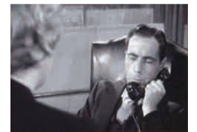
マルタの鷹