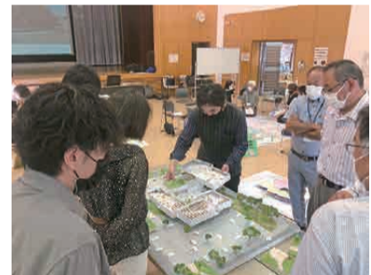
ワークショップ① 機能ごとの配置計画