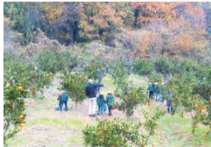
菅塩地区景観美活動