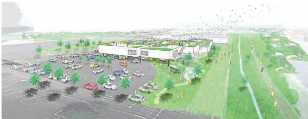
(仮称)太田西複合拠点公共施設 パース図

複合施設は老朽化が進む新田図書館の建て替えの他、図書館や保健センター、行政窓口機能を一つの施設に集約。より効率的な施設として、近隣施設を含めたエリアのにぎわいを創り、将来に向けて持続可能な施設(エリア)となることを目指します。