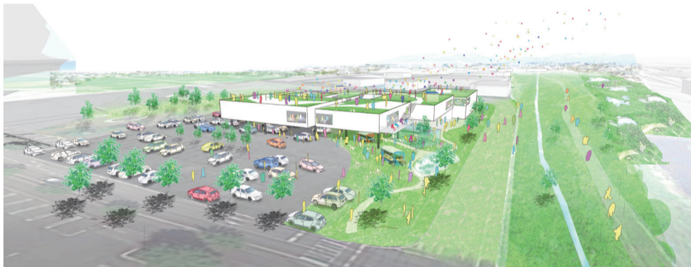
(仮称)太田西複合拠点公共施設 パース図

複合施設は老朽化が進む新田図書館の建て替えの他、図書館や保健センター、行政窓口機能を一つの施設に集約。より効率的な施設として、近隣施設を含めたエリアのにぎわいを創り、将来に向けて持続可能な施設(エリア)となることを目指します。