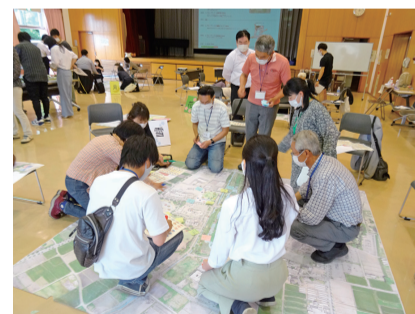
ワークショップ② 広域エリアでのにぎわいを考える