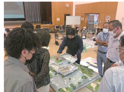
ワークショップ① 機能ごとの配置計画