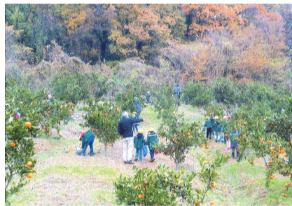
菅塩地区景観美活動