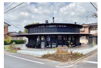
マグノリア コーヒーロースターズ