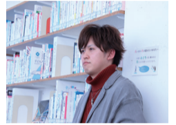
はしこー 作曲担当。アウトドア派。

限りある時間の中で夢を持って生きていと始めた活動。今まで多くの人に支えられてきました。自分たちの歩んだ道や思いを歌にして届けています。