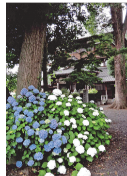
さざえ堂とあじさい(東今泉町)