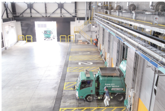
焼却炉へのごみ投入