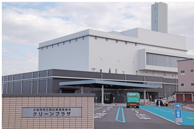
クリーンプラザはこちらから

新焼却炉施設(クリーンプラザ)は、昨年の12月1日から試験運転を開始しています。太田市・千代田町・大泉町・邑楽町から、ごみを受け入れる太田市外三町広域一般廃棄物処理施設として本格稼働します。