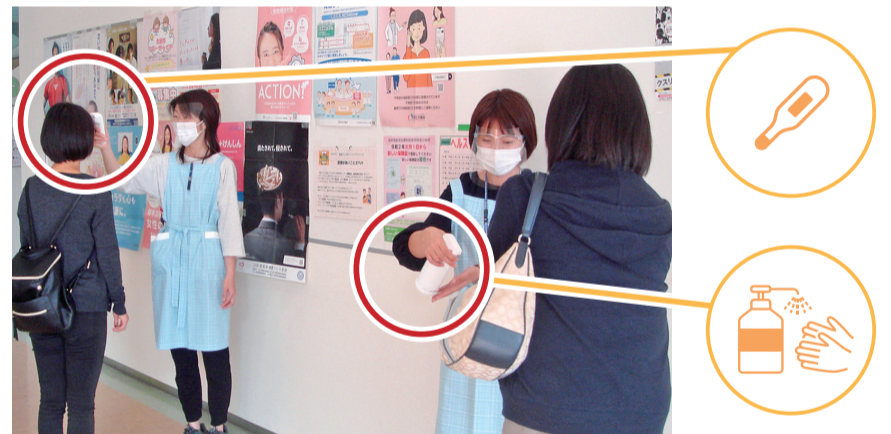
受診者にはマスク着用・健康チェック・手指消毒・検温を実施