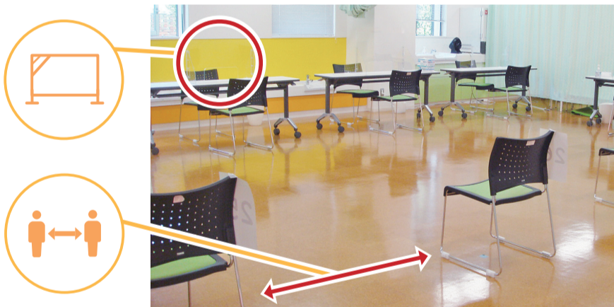
常時換気と消毒、椅子は2m空けて配置、対面場所にはアクリルパーテーションを使用