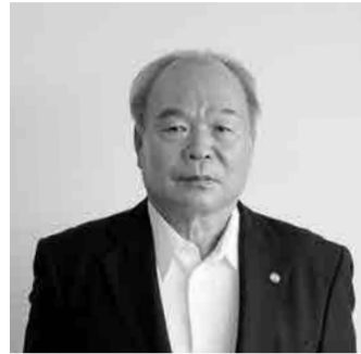
副市長 きむらまさかず 木村正一