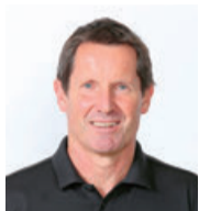
ロビー・ディーンズ 監督